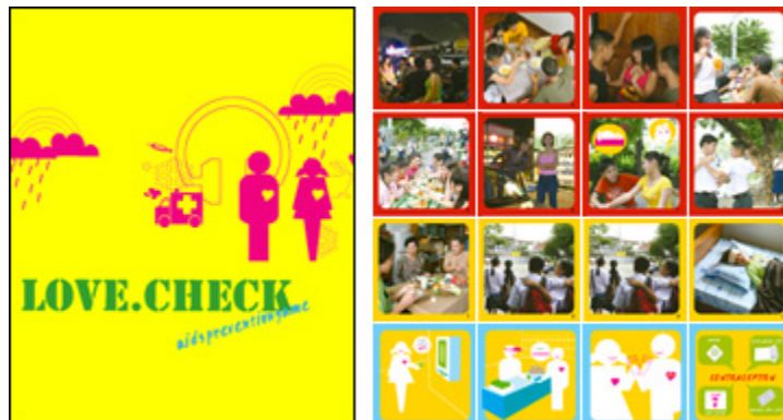
LOVE.check / Thailand

In 2004 is een LOVE.check spel voor Zuid Afrika ontwikkeld, later ook gebruikt in zuidelijk Afrika en andere Afrikaanse landen (31.000 ex). Talen: Engels, Zulu, Afrikaans en Swana.