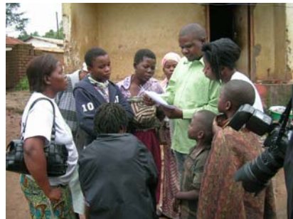
'The making of' Malawi & southern Africa 2009