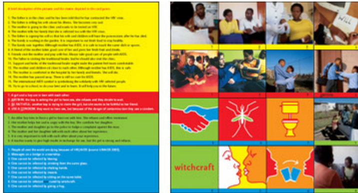
LOVE.check / zuidelijk Afrika

In 2007 ontvingen ruim 25 organisaties in o.a. Zuid Afrika, Zambia, Kenia, Swaziland, Lesotho, Botswana een nieuw spel LOVE.check. Dit spel is eerder ontwikkeld in 2004 en nadat het op tientallen plaatsen is gebruikt en kritisch getoetst zijn de verhaallijnen inhoudelijk aangepast. In 2007 was het gereed voor grote verspreiding in zuidelijk Afrika in een oplage van 31.000 spellen.