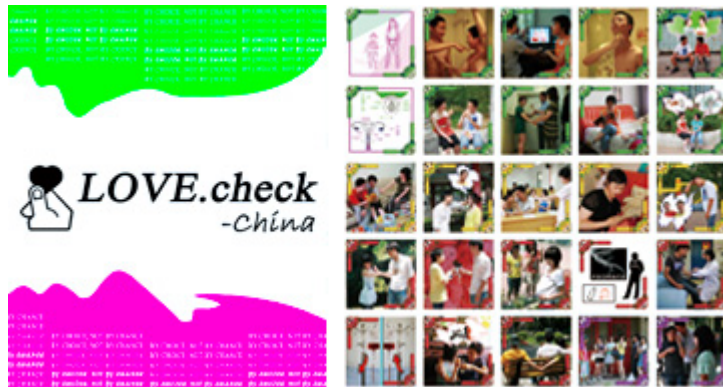
LOVE.check / China

In 2009 heeft de WEB.foundation na een lange voorbereiding en in nauwe samenwerking met de NGO Marie Stopes International China (MSIC) in Beijing, een pilot LOVE.check spel in een Chinese versie ontwikkeld. Het spel heeft de naam LOVE.check/China. Najaar 2009 en voorjaar 2010 werden deze spellen getest. De medewerkers van MSIC hebben tijdens hun zomerkamp in Xi'an studenten van universiteiten getraind om te gaan werken met LOVE.check / China. Zij reageerden positief.