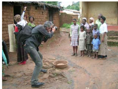
Ontwikkeling en fotografie FAMILY.matters in Malawi 2009