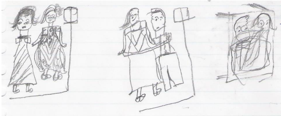
Kindertekening Tanzania 2008: The man and woman are going to have sex, but have to use a condom

Dit onderzoek kon worden gerealiseerd dankzij een financiële bijdrage van Rotary Rhooon Barendrecht.