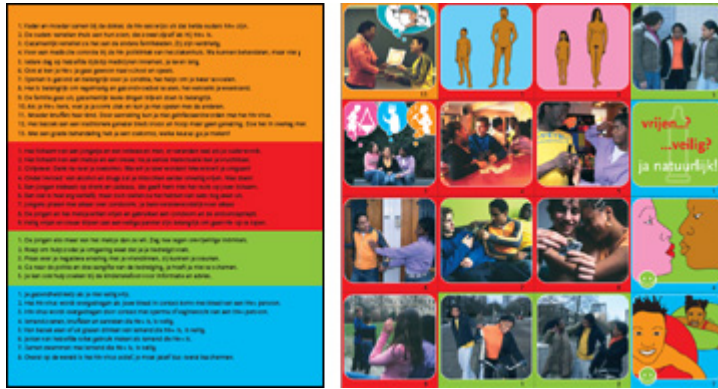
LOVE.check / Nederland