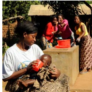
2009 FAMILY.matters Malawi & southern Africa